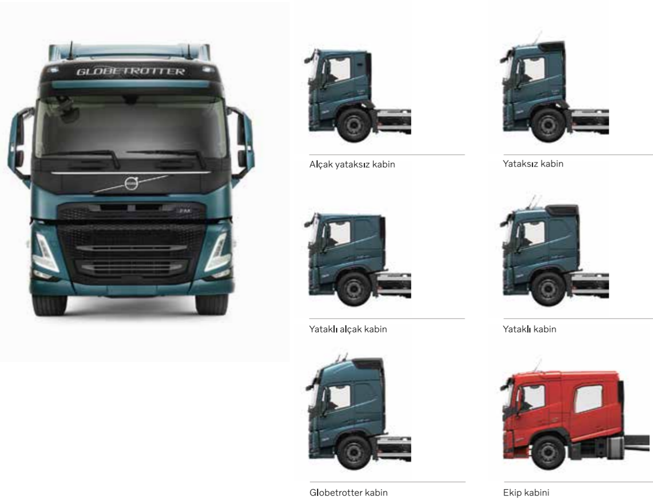
Alçak yataksız kabin