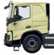
Yataklı alçak kabin